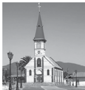
Iglesia Guayacán, Coquimbo, Chile