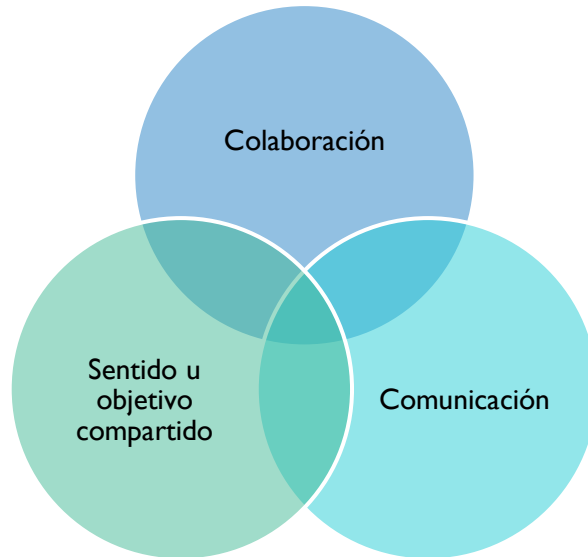
Figura I Principios orientadores para la conformación de equipos.