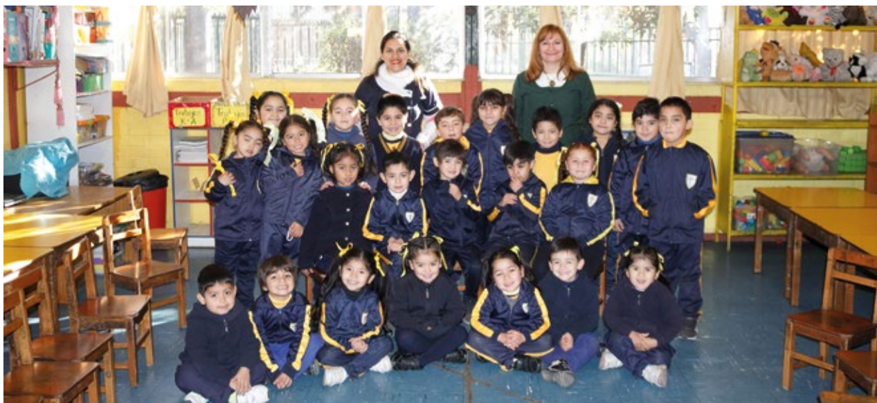
Foto: Escuela Santa Rita de Casia, en La Pintana.