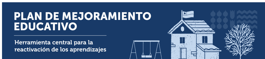
Figura 2: EL PME, herramienta central para la Reactivación Educativa