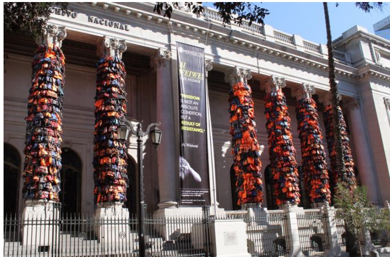
Weiwei en CorpArtes