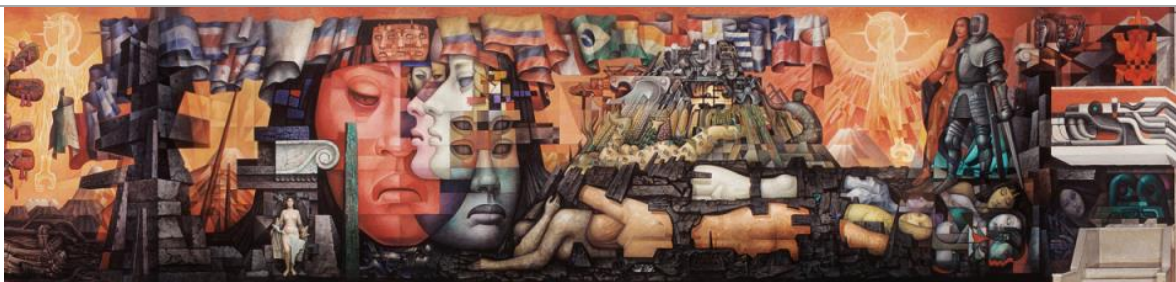
Presencia de América Latina de Jorge González Camarena

En los grupos anteriores junto al profesor, comentan las sensaciones emociones e ideas que les generó la observación de la obra. Luego, describen cómo el uso de los colores, formas y otros elementos de lenguaje visual presentes en el mural ayudan al propósito expresivo de la obra. A partir de la obra generan un texto acerca de la experiencia personal en torno al tema de nuestra identidad como chilenos y latinoamericanos. El profesor evalúa formativamente los textos considerando aspectos de redacción, ortografía y fundamentación de las opiniones.