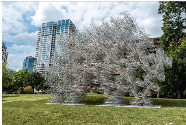
AI WEIWEI EN EL AN COMO PARTE DE LA MUESTRA "INOCULACIÓN" Extracto

La intervención Safe Passage, del artista chino Ai Weiwei, consiste en recubrir las 10 columnas del frontis del Archivo Nacional de Chile con miles de chalecos salvavidas originales, utilizados por los mismos refugiados que han llegado a la isla griega de Lesbos, escapando de sus países en conflicto. Mediante la instalación, Ai Weiwei invita a reflexionar sobre la crisis humanitaria de refugiados que afecta actualmente a Europa, al mismo tiempo que nos hace tomar conciencia de nuestros propios procesos de inmigración.