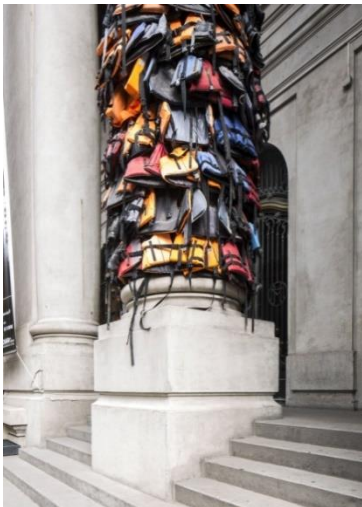
Weiwei en Archivo Nacional