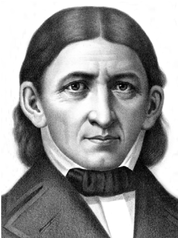
de Federico Fröebel.

Haciendo un breve paseo por la historia de la educación, encontramos en el siglo XVIII el nombre del alemán Federico Froebel, fundador o padre del jardín de infantes (kindergarten). Este educador vivió entre los años 1782 y 1852, tiempo en que su huella queda marcada por los aportes que hizo a la educación de su país y del mundo. Fue un revolucionario para su época y dio paso a un movimiento amplio de refuerzo a la educación temprana. Estaba convencido de que había que inculcar en los niños pequeños, “de mente cristalina”, la multilateralidad, la armonía y la integridad. Para él, la educación de los niños y niñas era un requisito indispensable, universal, un derecho natural de toda la humanidad.