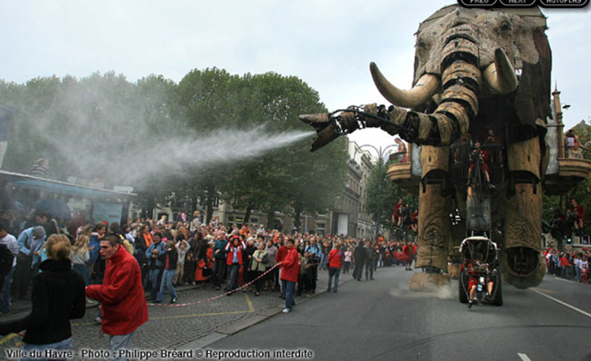
Ville du Havre - Photo : Philippe Bréard © Reproduction interdite