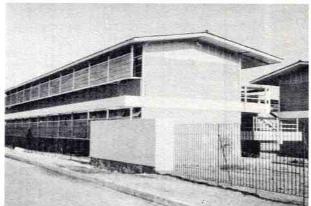
1 Faenas de construcción de la 1ª etapa de la Escuela Industrial de Recursos del Mar, Iquique.