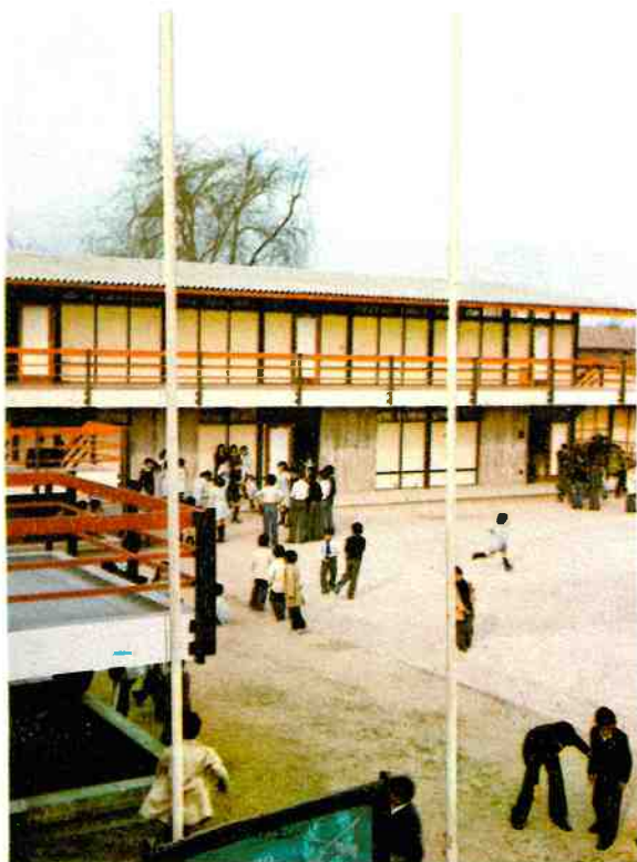
Escuela General Básica N° 532, de Santiago.