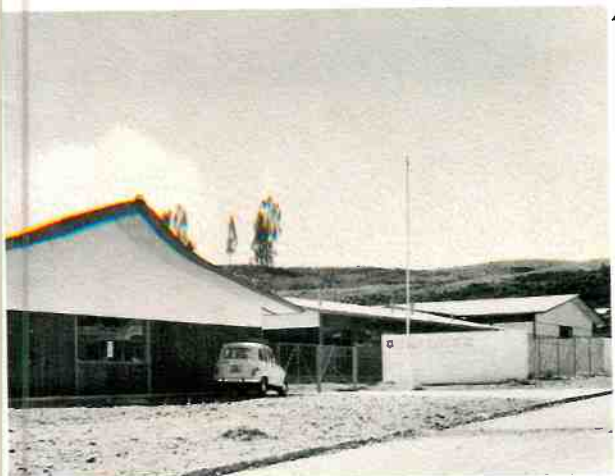
4 E.G.B. Nº 100 de Pichipelluco, Puerto Montt. 5 Patio interior E.G.B. Nº 101 de San Carlos.