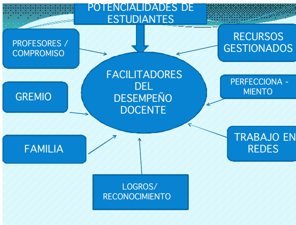
Figura 1: Facilitadores del desempeño docente:

La revisión que hacen los profesores de su trayectoria profesional parece organizarse en torno a dos ejes básicos: el de los facilitadores de su quehacer y el de los obstaculizadores de su quehacer. Los diagramas que siguen, dan cuenta de los factores involucrados en cada uno de los ejes y las relaciones básicas que se dan entre ellos.