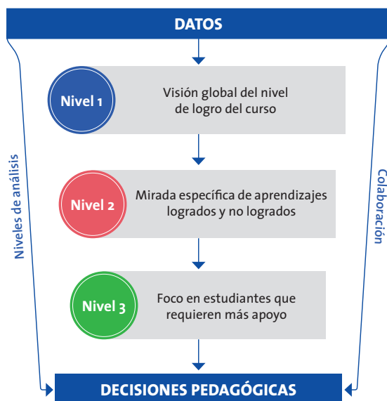
Figura 3.1 Procedimiento sugerido para el análisis

La Figura 3.1 sintetiza el procedimiento de análisis propuesto, mostrando tres niveles de análisis que es posible realizar a partir de los resultados.