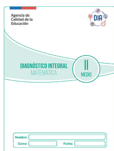
Prueba de Matemática 1