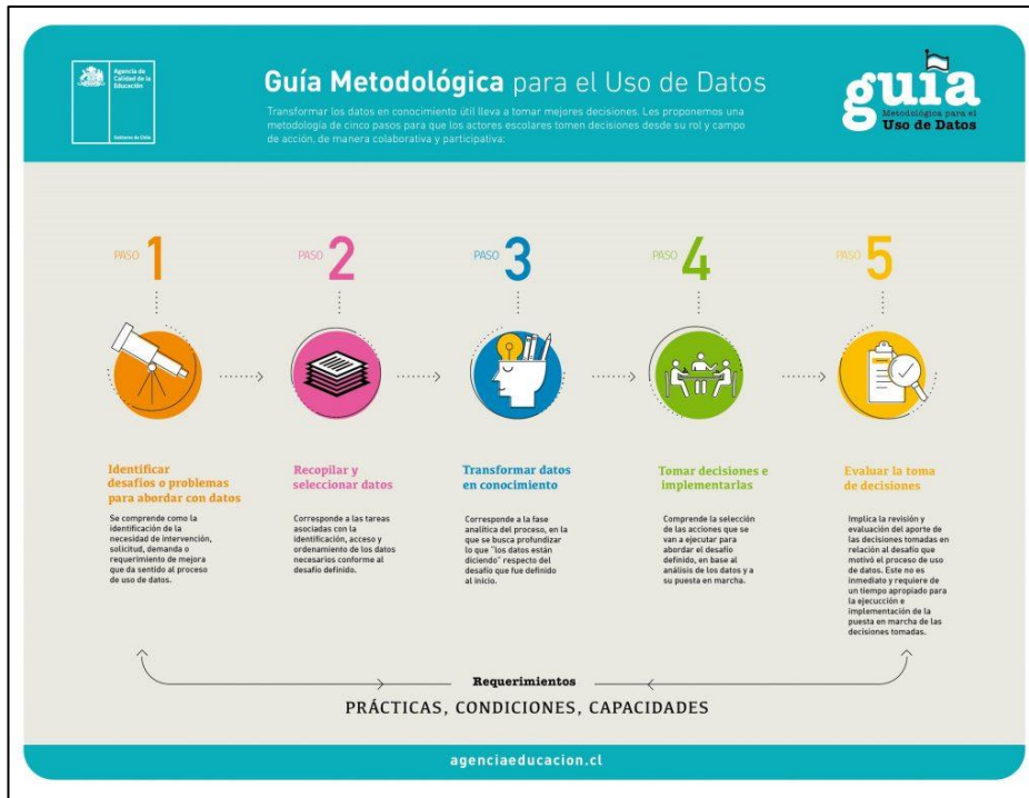
Figura 3. Modelo de uso de Datos de la Agencia de Calidad

La Guía de Uso de Datos y el consecuente modelo, son fundamentales para contextualizar el trabajo de las escuelas con los datos, y de esa manera resguardar el buen uso de estos. La revisión y análisis conjunto de los informes de resultados (en papel o en plataformas web) junto con la guía de uso de datos, buscan asegurar un uso correcto de los datos. Durante el presente plan se continuará con dichos esfuerzos y se enfatizará en la misión de orientar de la Agencia entregando información a la comunidad.