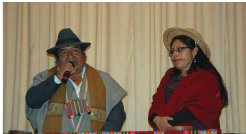
Sabio Formador Aymara y Educadora Tradicional Región de Tarapacá. MINEDUC-2012