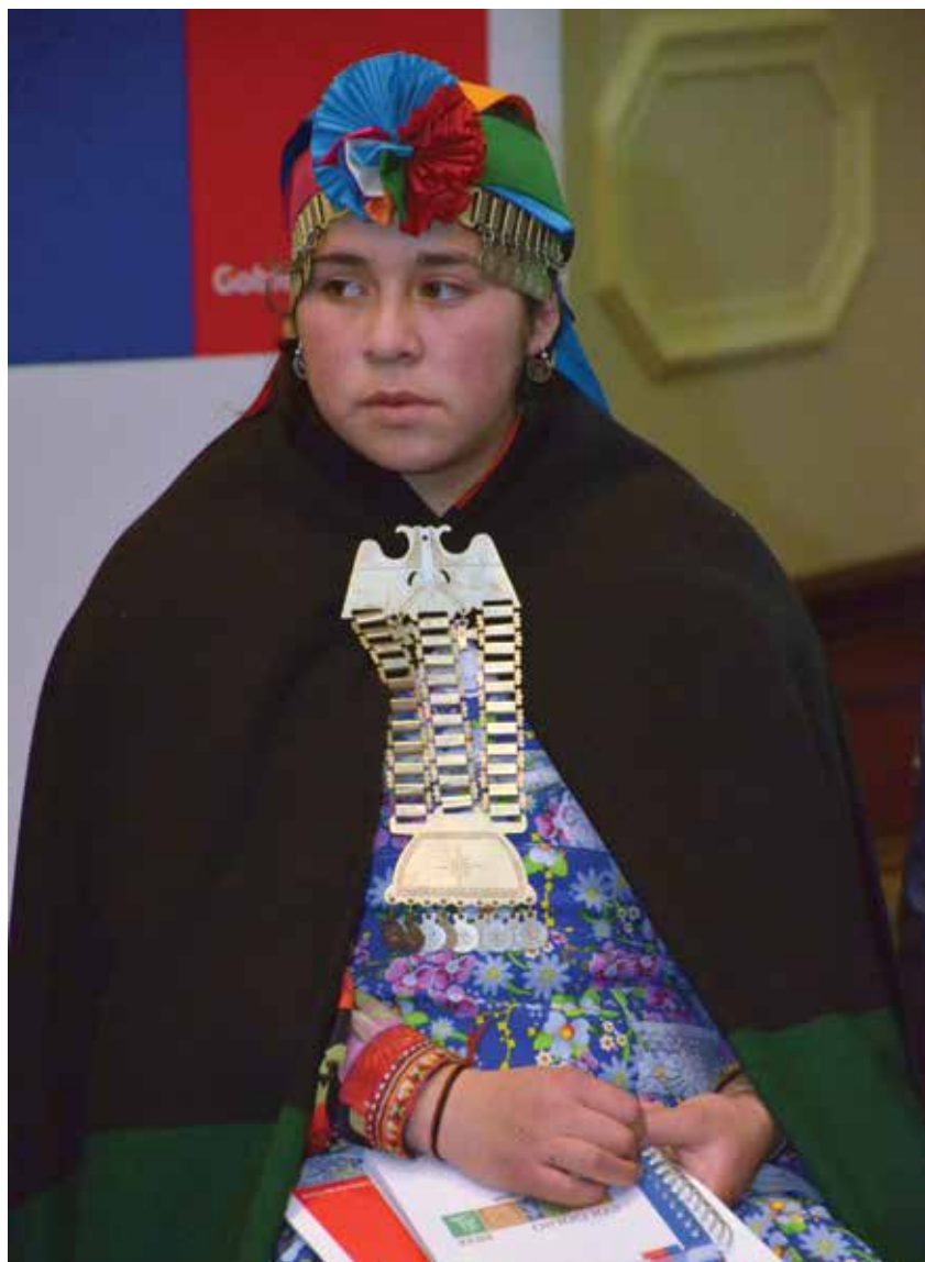
Estudiante Liceo Intercultural Guacolda de Chol Chol, Región de la Araucanía. UNICEF-2012.