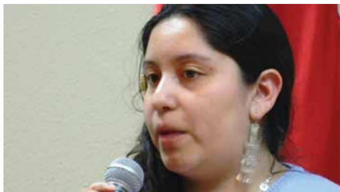
Educadora Tradicional Región de Magallanes. MINEDUC-2012

No obstante lo anterior, tanto los y las docentes como los y las estudiantes participantes del coloquio señalaron un conjunto de desafíos de cara al fortalecimiento y consolidación de la educación intercultural en Chile. De estos desafíos detectados, y de las propuestas que los actores del mundo educativo hicieron para enfrentarlos, se desprenden diferentes concepciones de la educación intercultural, que a su vez se hallan asociadas a distintas experiencias de la misma -contenidos ligados a los pueblos indígenas en el currículo escolar, talleres de lengua o cultura indígena, sector de Lengua Indígena, u otras-, las que por su variedad y flexibilidad pueden aportar a enriquecer el debate sobre las estrategias pasadas, presentes y futuras.